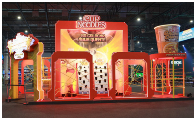
Estande da NISSIN na BGS

O estande em formato de circuito, “Zerando sua Fome”, destacou os principais atributos de Cup Noodles®. Os visitantes tiveram a oportunidade de conhecer as diferentes etapas de produção do produto, a diversidade de sabores e o método de preparo que é rápido e prático, ficando pronto em apenas três minutos —